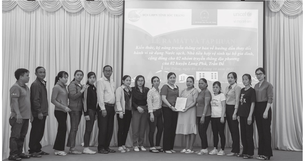
Hội LHPN huyện Trần Đề (Sóc Trăng) luôn quan tâm nâng cao kiến thức, kỹ năng cho cán bộ, hội viên phụ nữ.

Xác định phát triển đảng viên trong cán bộ, hội viên phụ nữ là động lực để chị em nỗ lực phấn đấu trong thực hiện nhiệm vụ cũng như vươn lên phát triển kinh tế, thời gian qua, Hội Liên hiệp Phụ nữ (LHPN) huyện Trần Đề (Sóc Trăng) luôn quan tâm lựa chọn, chăm bồi, giới thiệu quần chúng ưu tú để Đảng xem xét kết nạp. Từ đó đã góp phần phát huy vai trò của phụ nữ trong tham gia xây dựng Đảng, chính quyền, xây dựng tổ chức hội vững mạnh và thực hiện tốt công tác phát triển đảng viên ở địa phương.