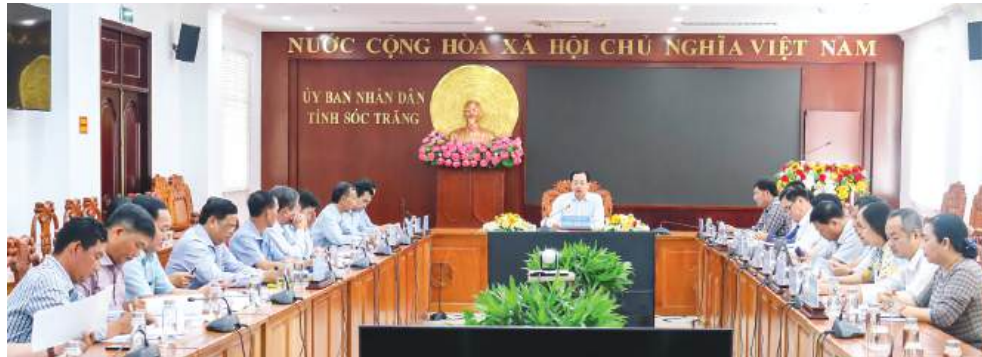
Đồng chí Vương Quốc Nam - Tỉnh ủy viên, Phó Chủ tịch UBND tỉnh Sóc Trăng phát biểu kết luận cuộc họp.

Ngày 26/8, tại UBND tỉnh Sóc Trăng, đồng chí Vương Quốc Nam - Tỉnh ủy viên, Phó Chủ tịch UBND tỉnh dự cuộc họp để nghe đơn vị liên quan báo cáo tình hình thực hiện và tiến độ giải ngân các nguồn vốn thực hiện Chương trình mục tiêu quốc gia xây dựng nông thôn mới trên địa bàn tỉnh 7 tháng đầu năm và đề ra giải pháp, nhiệm vụ những tháng cuối năm 2024. Tham dự có lãnh đạo các sở, ban ngành liên quan; lãnh đạo UBND các huyện, thị xã trên toàn tỉnh.