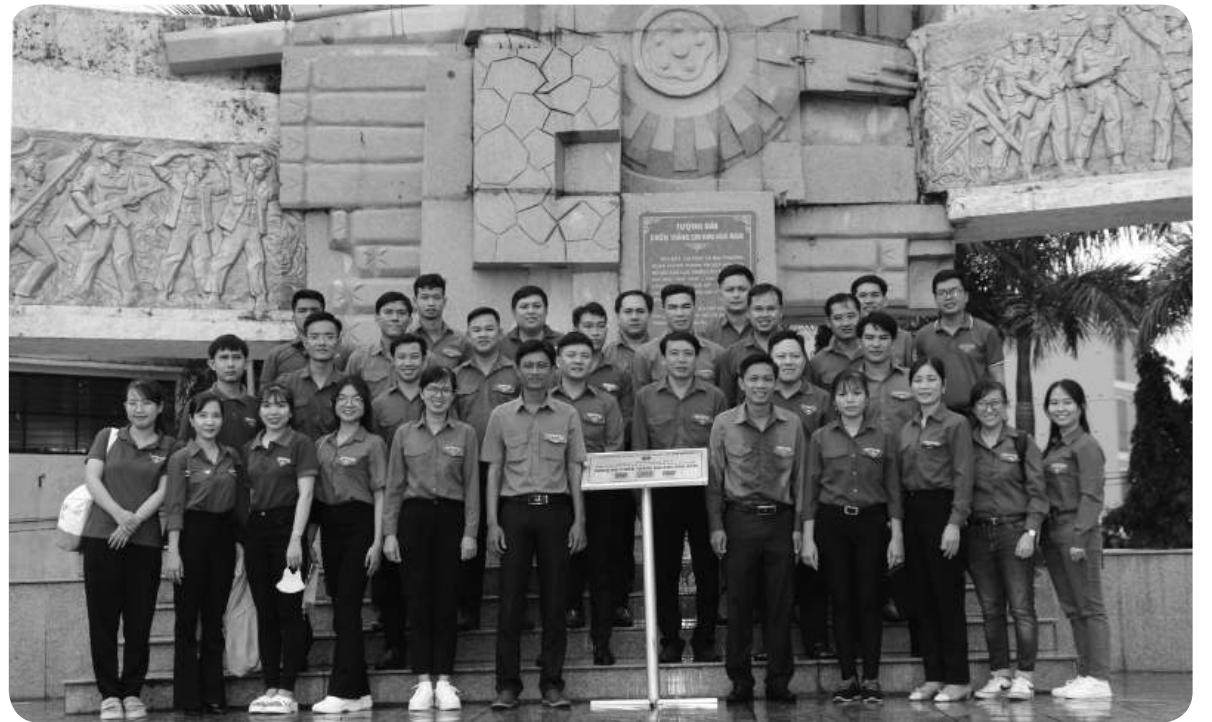
Đoàn Khối các cơ quan và doanh nghiệp tỉnh Sóc Trăng và Thị đoàn Ngã Năm phối hợp thực hiện công trình thanh niên Tra cứu thông tin di tích văn hóa, lịch sử Tượng đài chiến thắng Chi khu Ngã Năm (thị xã Ngã Năm, tỉnh Sóc Trăng).

“Đoàn kết - Sáng tạo” là một trong những phong trào trọng tâm của đoàn thanh niên. Thời gian qua, các cấp bộ đoàn trong tỉnh Sóc Trăng đã triển khai hiệu quả phong trào này nhằm khơi dậy tinh thần sáng tạo của đoàn viên, thanh niên để hiện thực hóa ý tưởng sáng tạo của tuổi trẻ.