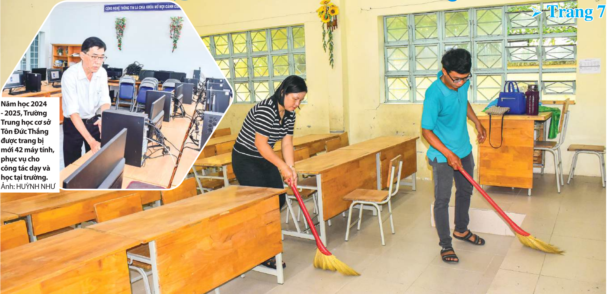
Năm học 2024 - 2025, Trường Trung học cơ sở Tôn Đức Thắng được trang bị mới 42 máy tính, phục vụ cho công tác dạy và học tại trường.