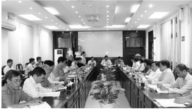
Quang cảnh cuộc họp.

Tại cuộc họp, các đại biểu đã xem xét, thảo luận một số tờ trình, như: Tờ trình số 137/