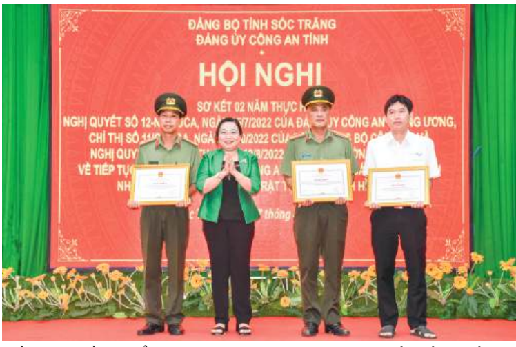
Đồng chí Hồ Thị Cẩm Đào - Phó Bí thư Thường trực Tỉnh ủy, Chủ tịch HĐND tỉnh Sóc Trăng trao bằng khen của Chủ tịch UBND tỉnh cho các tập thể.

Sóc Trăng bố trí lực lượng công an chính quy tại 92 công an xã, thị trấn >2