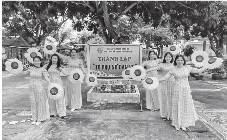
Quan tâm thành lập các tổ, nhóm phù hợp với sở thích, điều kiện để thu hút phụ nữ tham gia vào hội.

Hội cũng xác định đây là nhiệm vụ quan trọng trong công tác xây dựng tổ chức hội vững mạnh; đồng thời là tiêu chí cơ bản trong đánh giá chất lượng hoạt động chi hội và cơ sở hội. Tính từ đầu nhiệm kỳ (2021 - 2026) đến nay, các cấp hội đã giới thiệu cho tổ chức Đảng xem xét, bồi dưỡng, phát triển đảng