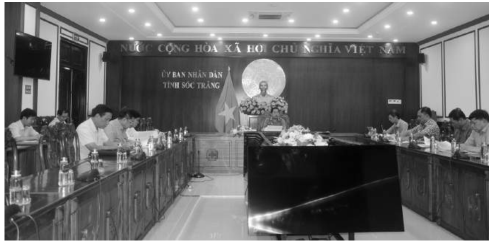
Các đại biểu tham dự buổi làm việc.

Theo thỏa thuận hợp tác phát triển kinh tế - xã hội giữa Thành phố Hồ Chí Minh với tỉnh Sóc Trăng, 2 tỉnh sẽ hợp tác ở 2 nội dung là kết nối, tiêu thụ nông sản và giới thiệu các doanh nghiệp tiềm năng đầu tư vào tỉnh Sóc Trăng. Đến nay, một số sở, ngành 2 địa phương đã kết nối, chủ yếu là trưng bày, giới thiệu sản phẩm địa phương. Thời gian tới, Thành phố Hồ Chí Minh sẽ tổ chức đoàn đi khảo sát nhu cầu đầu tư vào tỉnh Sóc Trăng; khảo sát, học tập mô hình tại các làng nghề, ngành nghề có sản phẩm