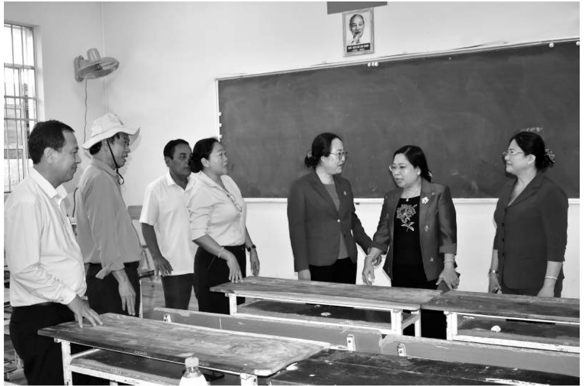
Đoàn công tác của tỉnh kiểm tra cơ sở vật chất chuẩn bị năm học mới tại Trường Trung học phổ thông Nguyễn Khuyến, thị xã Vĩnh Châu (Sóc Trăng).