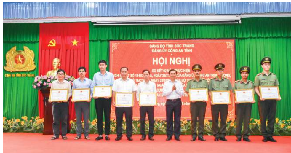
Đồng chí Trần Văn Lâu - Phó Bí thư Tỉnh ủy, Chủ tịch UBND tỉnh Sóc Trăng trao bằng khen cho các cá nhân.

Đảng ủy Công an tỉnh cũng đánh giá, mặc dù công an xã, thị trấn được bổ sung nhưng vẫn chưa đủ để đáp ứng yêu cầu nhiệm vụ, do công việc ở cơ sở ngày càng nhiều. Việc thực hiện các mục tiêu của nghị quyết theo lộ trình từng lúc chưa