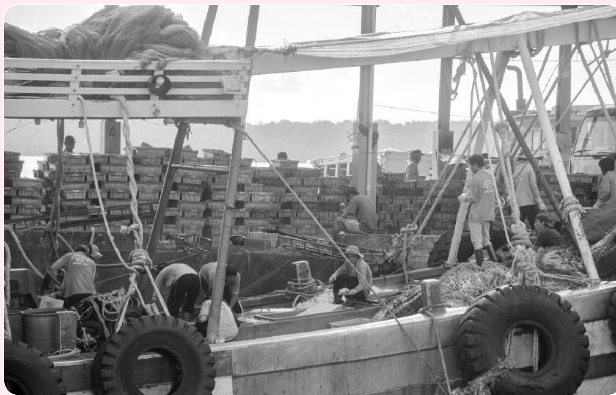
Huyện Trần Đề (Sóc Trăng) có điều kiện thuận lợi để phát triển kinh tế biển.

Tính đến nay, đã có hàng trăm doanh nghiệp tham gia lĩnh vực sơ chế, chế biến thủy hải sản; phát triển của một hệ thống liên hoàn giữa đánh