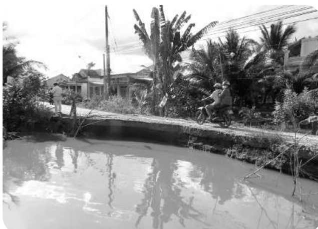
Xã An Mỹ, huyện Kế Sách (Sóc Trăng) là địa phương xảy ra sạt lở nhiều nhất.