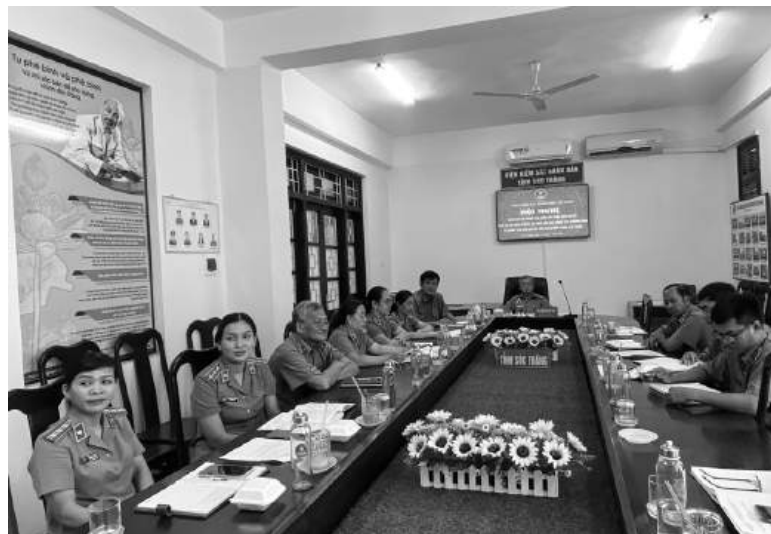
Phòng 9 Viện Kiểm sát nhân dân tỉnh Sóc Trăng thực hiện tốt công tác kiến nghị, kháng nghị.

Khi kiểm sát bản án, quyết định của tòa án, nếu phát hiện vi phạm, kiểm sát viên phải kịp thời báo cáo lãnh đạo phụ trách về đường lối xử lý. Phòng 9 thường xuyên phối hợp với cấp huyện trong việc gửi bản án, quyết định cấp sơ thẩm. Qua đó, kiểm tra chặt chẽ cả hình thức lẫn nội dung của bản án, quyết định nếu phát hiện vi phạm nghiêm trọng, báo cáo lãnh đạo thực hiện quyền kháng nghị phúc thẩm; trường hợp thời hạn cấp phúc thẩm đã hết, báo cáo lãnh đạo phụ trách xem xét để báo cáo Viện Kiểm sát cấp cao kháng nghị theo thủ tục giám đốc thẩm. Thông qua số liệu thống kê việc giải quyết của cấp huyện gửi lên, hàng tháng đối chiếu với bản án, quyết định của cấp huyện gửi lên, phòng sẽ trao đổi, nhắc