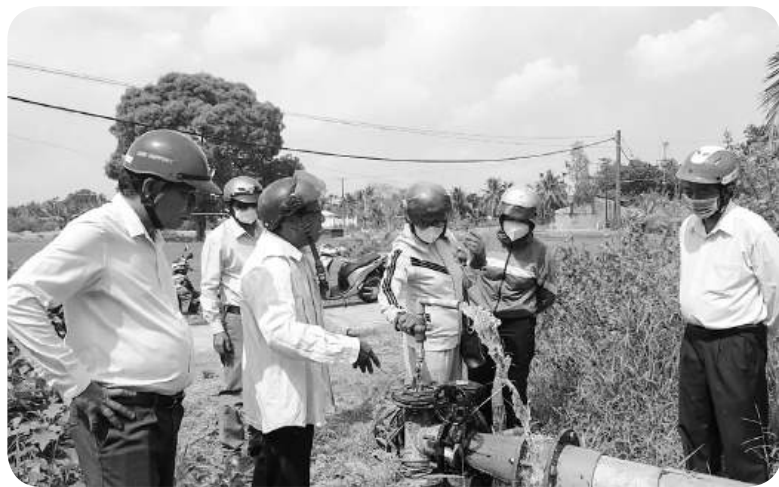
Lãnh đạo HĐND huyện Kế Sách (Sóc Trăng) giám sát hoạt động của các đơn vị trong lĩnh vực cấp nước đô thị.