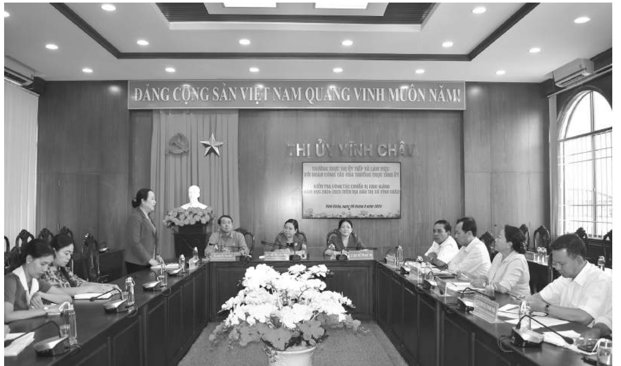
Quang cảnh buổi làm việc của đoàn công tác tỉnh Sóc Trăng tại Thị ủy Vĩnh Châu.

năm học mới; ngành Giáo dục huyện khẩn trương rà soát lại công tác chuẩn bị khai giảng và tổ chức lễ khai giảng chu đáo, tiết kiệm, hiệu quả, thật sự là ngày hội của các thầy, cô giáo và toàn thể học sinh. Bên cạnh đó, lãnh đạo Thị ủy, UBND thị