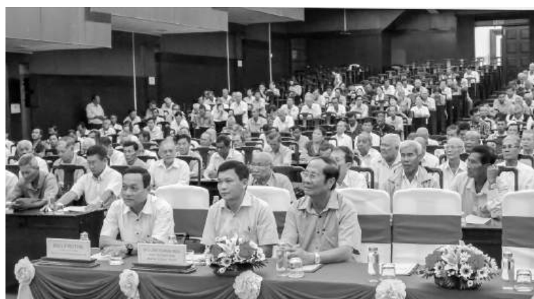
Các đại biểu tham gia buổi tập huấn.

Sáng ngày 26/8, tại Trung tâm Văn hóa và Hội nghị tỉnh Sóc Trăng, Ban Dân tộc tỉnh tổ chức Hội nghị tập huấn cung cấp thông tin cho trường ban nhân dân ấp, khóm, người có uy tín thuộc Tiểu dự án 1, Dự án 10, Chương trình mục tiêu quốc gia phát triển kinh tế - xã hội vùng đồng bào dân tộc thiểu số trên địa bàn tỉnh Sóc Trăng. Dự hội nghị có các đồng chí: Lý Rotha - Tỉnh ủy viên, Phó Chủ tịch HĐND tỉnh; Lâm Hoàng Mẫu - Phó Trưởng Ban Dân tộc tỉnh cùng 484 đại biểu là trường ban nhân dân ấp, khóm, người có uy tín trong vùng đồng bào dân