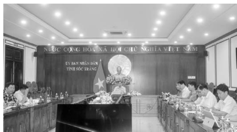
Các đại biểu tham dự cuộc họp.

Sáng ngày 4/9, tại UBND tỉnh Sóc Trăng, đồng chí Lâm Hoàng Nghiệp - Ủy viên Ban Thường vụ Tỉnh ủy, Phó Chủ tịch Thường trực UBND tỉnh có buổi làm việc với các ngành liên quan để nghe báo cáo sơ bộ về kế hoạch đầu tư công trung hạn giai đoạn 2026 - 2030.