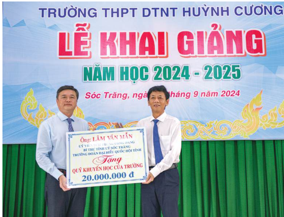
Bí thư Tỉnh ủy Lâm Văn Mẫn trao tặng cho Quỹ Khuyến học của trường.

Sáng ngày 5/9, các trường học trên địa bàn tỉnh Sóc Trăng hân hoan tổ chức khai giảng năm học mới. Các đồng chí lãnh đạo tỉnh Sóc Trăng đã đến chúc mừng và trao tặng các phần quà cho nhà trường, học bổng cho học sinh.