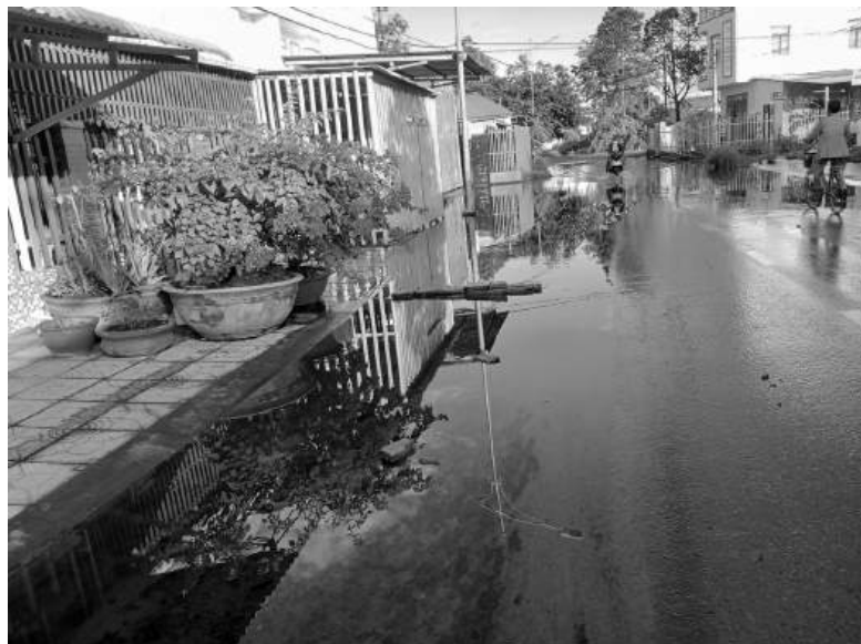
Đoạn đường Trần Thủ Độ ngập nước nhiều tháng nay.

Từ đầu mùa mưa năm 2024 đến nay, đường Trần Thủ Độ (đoạn tiếp giáp với đường Võ Văn Kiệt (Quốc lộ 1A cũ) và giao nhau với đường Lưu Khánh Đức), Phường 2, thành phố Sóc Trăng (Sóc Trăng) luôn trong tình trạng ngập nước. Từ đó làm đảo lộn sinh hoạt của