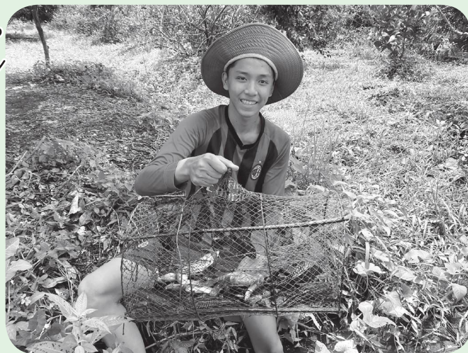
Đổ lờ bắt cá.

Việc đặt lờ có thể diễn ra quanh năm nhưng "cá chạy" nhất là từ tháng Năm đến tháng Mười âm lịch, khi trời bắt đầu đổ mưa và nước từ thượng nguồn đổ về ngập các dòng kênh, con rạch, chùng đó tôm cá rất nhiều, tha