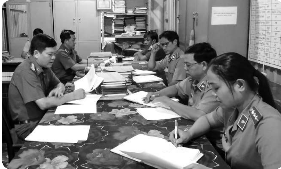
Viện kiểm sát nhân dân hai cấp quan tâm thực hiện tốt công tác kiểm sát giải quyết KNTC trong hoạt động tư pháp.

Công tác kiểm sát việc giải quyết khiếu nại, tố cáo (KNTC) trong hoạt động tư pháp luôn được lãnh đạo viện kiểm sát nhân dân hai cấp tỉnh Sóc Trăng quan tâm lãnh đạo, chỉ đạo thực hiện và xác định đây là nhiệm vụ chính trị hết sức quan trọng, thường xuyên của ngành. Từ đó, chất lượng công tác này không ngừng được nâng lên, đảm bảo các quyền và lợi ích hợp pháp của Nhà nước, tổ chức, công dân.