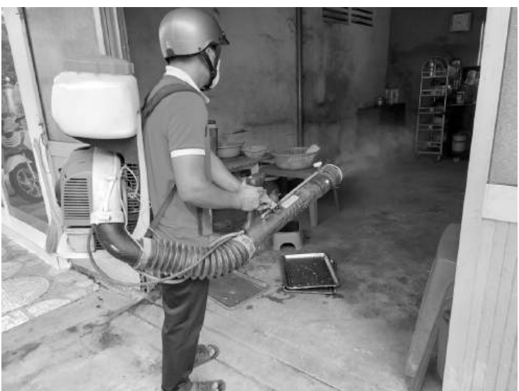
Phun hóa chất, khống chế ổ dịch sốt xuất huyết.

Bên cạnh đó, Trung tâm Kiểm soát bệnh tật tỉnh giám sát, điều tra côn trùng truyền bệnh sốt xuất huyết chủ động tại 10 xã, phường, thị trấn; giám sát, điều tra chiến dịch diệt lăng quăng chủ động vòng 1 năm 2024 tại 8 huyện, thị xã; giám sát, điều tra, xử lý ổ dịch sốt xuất huyết tại các địa điểm xảy ra dịch trên địa bàn tỉnh Sóc Trăng tại 10 huyện, thị xã, thành phố. Trung tâm Kiểm soát bệnh tật thực hiện thường xuyên công tác giám sát, xử lý ca