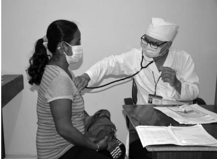
Tăng cường hoạt động phòng, chống dịch bệnh.

Từ đầu năm 2024 đến nay, Trung tâm Kiểm soát bệnh tật tỉnh Sóc Trăng đã triển khai nhiều hoạt động chuyên môn, với sự tham gia tích cực của cộng đồng trong các hoạt động phòng, chống dịch bệnh, góp phần giảm nguy cơ lan truyền bệnh, khống chế không để dịch xảy ra.