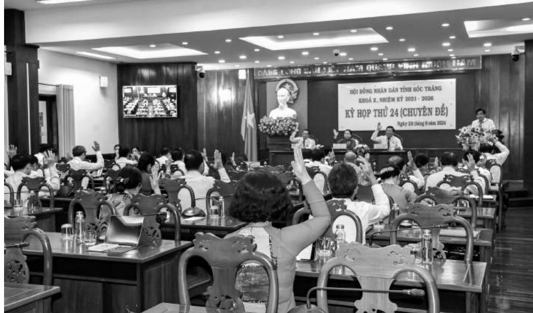
Đại biểu HĐND tỉnh Sóc Trăng biểu quyết thông qua nghị quyết điều chỉnh chủ trương đầu tư nâng cấp mở rộng Đường tỉnh 940.

Trong quá trình thực hiện lập báo cáo chủ trương đầu tư, Ban Quản lý Dự án 2 đã có văn bản lấy ý kiến các sở, ngành và địa phương về sự phù hợp và quy mô đầu tư cầu Mỹ Phước là phù hợp để đầu tư. Tuy nhiên, thời gian lập báo cáo để xuất chủ trương đầu tư gấp rút và chỉ đầu tư xây dựng mới cầu giao thông trên cống cũ, Ban Quản lý Dự án 2 chưa kịp thời đánh giá được tình trạng xuống cấp của cống Mỹ Phước, chưa có điều kiện thực hiện kiểm định chất lượng cống. Đồng thời, trong quá trình tổ chức thực hiện dự án, Ban Quản lý Dự án 2 chưa đánh giá hết được hiện trạng và chưa lường trước giải pháp thiết kế không đồng bộ về kết cấu (xây dựng mới cầu Mỹ Phước trên cống hiện trạng đang khai thác, đã xuống cấp nghiêm trọng), gây khó khăn và không thể triển khai