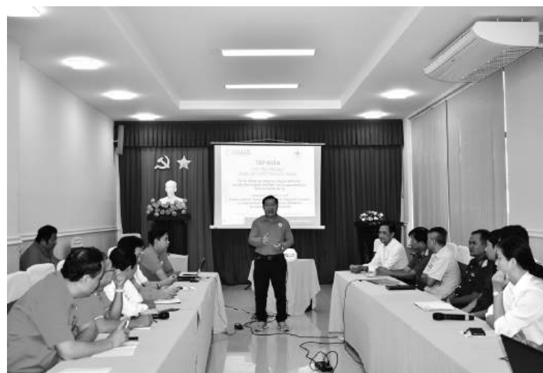
Quang cảnh lớp tập huấn về chương trình cứu trợ tiền mặt.

Việc tham gia lớp tập huấn rất quan trọng và hữu ích đối với các thành viên Đội ứng phó thiên tai, thảm họa cấp tỉnh, đặc biệt khi triển khai các hoạt động liên quan đến cấp phát tiền mặt ở nhiều lĩnh vực khác nhau như: ứng phó thảm họa, phục hồi sau thiên tai, chăm sóc sức khỏe, công tác xã hội... Qua lớp tập huấn, các học viên có được kiến thức nền tảng để tiếp cận và thực hiện chương trình cứu trợ tiền mặt để sẵn sàng triển khai các hoạt động liên quan một cách hiệu quả.