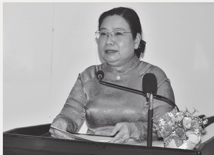
Đồng chí Hồ Thị Cẩm Đào - Phó Bí thư Thường trực Tỉnh ủy, Chủ tịch HĐND tỉnh Sóc Trăng phát biểu tại buổi lễ.

ngày càng nâng cao hiệu quả tuyên truyền theo hướng báo chí đa phương tiện. Thường xuyên đổi mới, cập nhật thông tin, tăng cường làm phong phú, hấp dẫn các chuyên mục: Thời sự - chính trị; kinh tế; xã hội; quốc phòng - an ninh; pháp luật; giáo dục - khoa học công nghệ, quốc tế; trang địa phương. Nhiều sản phẩm báo chí hiện đại, tăng hiệu ứng, tăng tính hấp dẫn, giúp cho việc truyền tải thông tin trở nên dễ dàng, sinh động hơn,