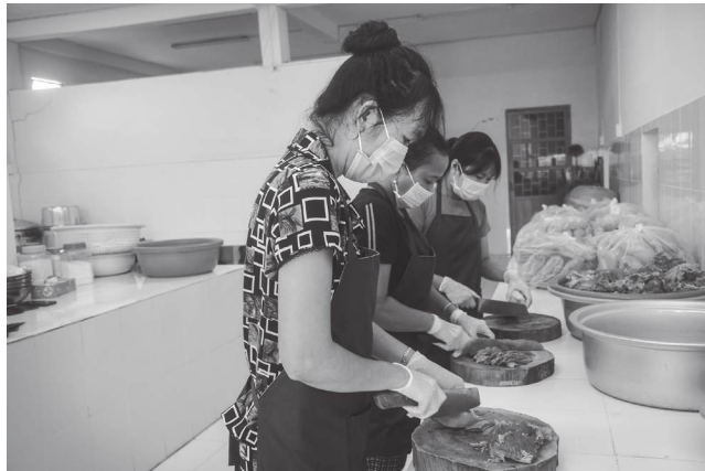
Nhà trường duy trì tốt bếp ăn tập thể.

Mặt khác, ngay từ đầu mỗi năm học, nhà trường còn quan tâm nâng cao trình độ của giáo viên. Đến nay, 100% giáo viên, cán bộ quản lý nhà trường đều đạt chuẩn và trên chuẩn. Giáo viên nhà trường thường xuyên trau dồi kiến thức để nâng cao chất lượng giáo