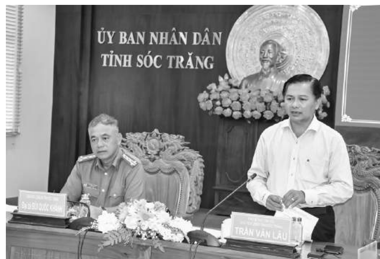
Đồng chí Trần Văn Lâu - Phó Bí thư Tỉnh ủy, Chủ tịch UBND tỉnh, Tổ trưởng Tổ công tác triển khai Đề án 06 tỉnh Sóc Trăng phát biểu tại hội nghị.

Tổ công tác triển khai Đề án 06 tỉnh cũng đánh giá, tính đến ngày 20/8/2024, tỉnh Sóc Trăng