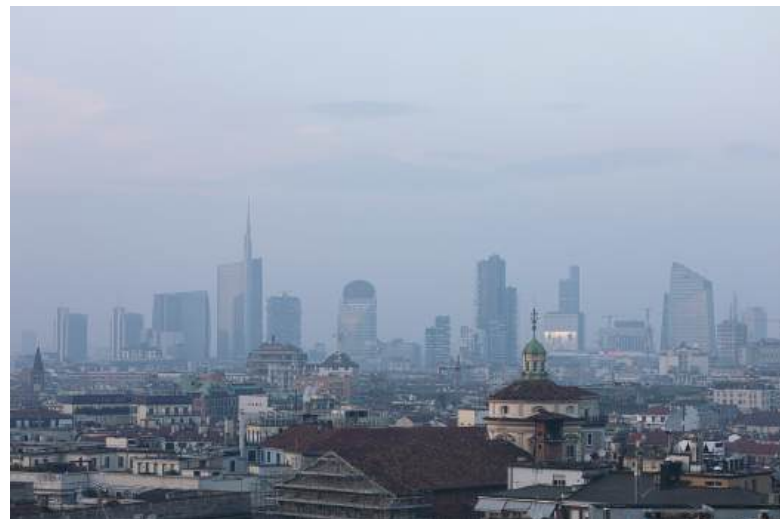
Không khí ô nhiễm bao trùm thành phố Milan, Italy ngày 20/2/2024.