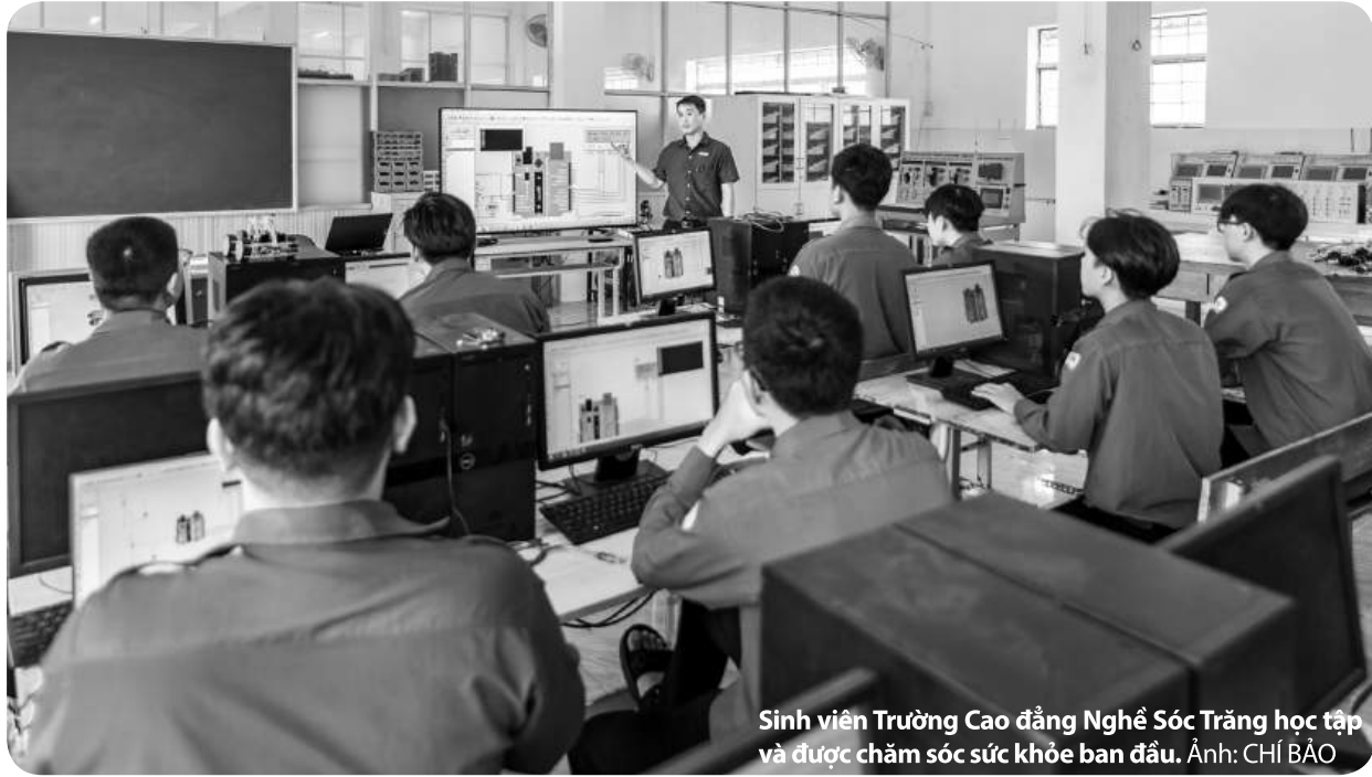
Sinh viên Trường Cao đẳng Nghề Sóc Trăng học tập và được chăm sóc sức khỏe ban đầu.