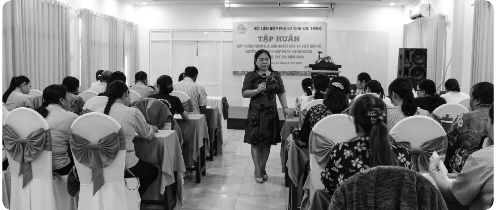
Hội Liên hiệp Phụ nữ tỉnh Sóc Trăng tăng cường tập huấn liên quan đến bình đẳng giới và bảo vệ phụ nữ, trẻ em.

Với vai trò gắn kết và bảo vệ quyền lợi cho phụ nữ, hội liên hiệp phụ nữ các cấp trên địa bàn tỉnh Sóc Trăng đã đa dạng hóa các hoạt động thông tin, tuyên truyền về bình đẳng giới; tăng cường kiểm tra, đánh giá tình hình thực hiện các quy định của pháp luật về bình đẳng giới. Đồng thời, động viên, khuyến khích phụ nữ nâng cao trình độ và tích cực tham gia vào các hoạt động chính trị, kinh tế, xã hội... từng bước khẳng định vai trò, vị thế trong gia đình và xã hội.