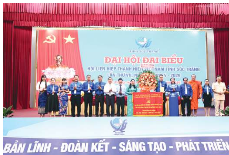
Lãnh đạo Tỉnh ủy, UBND tỉnh tặng lễ hoa, bức trướng với dòng chữ Thanh niên Sóc Trăng: Bản lĩnh - Đoàn kết - Sáng tạo - Phát triển cho đại hội.

Tại đại hội, các đại biểu đã thống nhất với 10 chỉ tiêu nhiệm kỳ 2024 - 2029 gồm: có 100% cán bộ được quán triệt, học tập và 80% thanh niên được tuyên truyền, phổ biến về các nghị quyết của Đảng, Đoàn và Hội, được cung cấp thông tin về chính sách, pháp luật, trang bị kiến thức về quốc phòng và an ninh; hằng năm, Ủy ban Hội tỉnh tổ chức ít nhất 2 hoạt động tham gia bảo tồn, phát huy bản sắc văn hóa dân tộc; có 100 dự án khởi nghiệp đổi mới sáng tạo của thanh niên được kết nối với các doanh nghiệp, quỹ đầu tư mạo hiểm hoặc được hỗ trợ đầu tư từ nguồn kinh phí phù hợp; xây dựng ít nhất 50 công trình