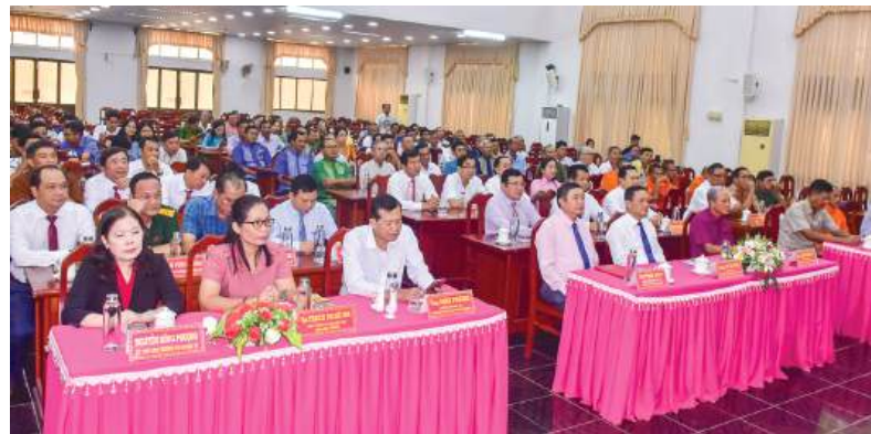
Quang cảnh buổi họp mặt mừng Lễ Sene Đôn Ta của đồng bào Khmer huyện Long Phú (Sóc Trăng).