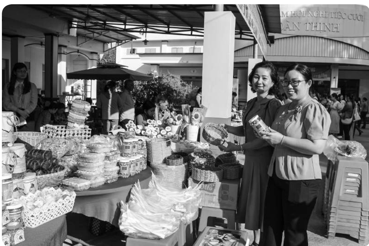
Các cấp hội phụ nữ trong tỉnh Sóc Trăng đã tạo điều kiện để chị em phụ nữ khởi nghiệp với các mô hình, sản phẩm độc đáo để nâng cao quyền năng phụ nữ.

Hội phụ nữ các cấp trên địa bàn tỉnh đã có nhiều đóng góp quan trọng vì sự tiến bộ, bình đẳng của phụ nữ. Tuy nhiên, quan trọng nhất vẫn là sự thiết lập được các mối quan hệ tốt trên cơ sở của sự hiểu biết và tình yêu thương, tôn trọng lẫn nhau để đi đến con đường hạnh phúc. Do vậy, trách nhiệm bình đẳng giới không chỉ là nghĩa vụ và trách nhiệm của mỗi cá thể, mà còn là nghĩa vụ và trách nhiệm của mỗi mái ấm gia đình và toàn xã hội. Đó là cơ sở quan trọng trong xây dựng gia đình "no ấm, bình đẳng, văn minh và hạnh phúc".