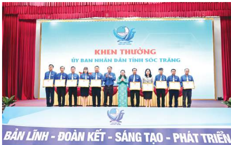
Trao bằng khen của Chủ tịch UBND tỉnh Sóc Trăng cho các tập thể và cá nhân có thành tích tiêu biểu trong công tác Hội và phong trào thanh niên nhiệm kỳ 2019 - 2024.

Trong nhiệm kỳ 2019 - 2024, công tác hội và phong trào thanh niên đạt nhiều kết quả tích cực. Phong trào Tôi yêu Tổ quốc tôi tiếp tục được các cấp bộ hội trong tỉnh triển khai sâu rộng, phát huy được tinh thần xung kích, tình nguyện, sáng tạo của hội viên, thanh niên. Kết quả, các cấp bộ hội đã xây dựng 71 câu thanh niên nông thôn, 50 công trình thấp sáng đường quê, 213 tuyến đường hoa nông thôn kiểu mẫu, 88 nhà tiêu hợp vệ sinh. Đồng thời tổ chức tư vấn sức khỏe, khám bệnh miễn phí,