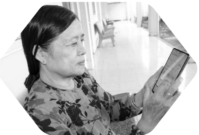
Nhiều tiện ích khi người dân được chi trả ASXH qua tài khoản.

Tính đến ngày 12/8/2024, toàn tỉnh có 11/11 đơn vị đã thực hiện chi trả không dùng tiền mặt qua tài khoản cho 6.368/54.049 đối tượng, chiếm tỷ lệ 11,78% (trong đó người có công là 1.715/7.847 đối tượng, chiếm 21,86%; bảo trợ xã hội là 4.653/46.202 đối tượng, chiếm 10,07%), với tổng kinh phí trên 31,1 tỷ đồng (người có công trên 21,9 tỷ đồng, bảo trợ xã hội trên 9,2 tỷ đồng). Các địa phương triển khai thực hiện tốt đến thời điểm này như: thị xã Ngã Năm, huyện Trần Đề, huyện Long Phú, huyện Châu Thành.