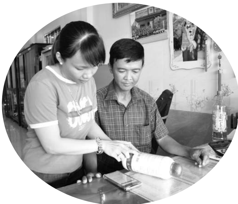
Chủ đại lý thức ăn, thuốc thủy sản Trúc Lam, ấp An Nghiệp, xã An Thạnh 3, huyện Cù Lao Dung (Sóc Trăng) tra cứu sản phẩm trên hệ thống của Cục Thủy sản.