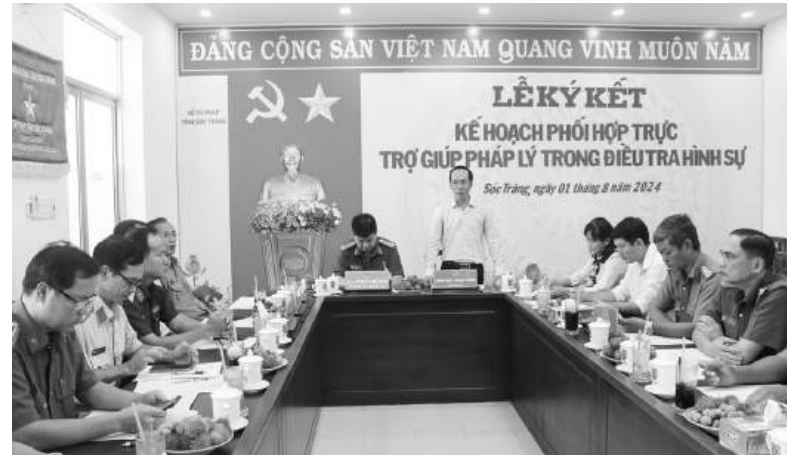
Sở Tư pháp tỉnh Sóc Trăng ký kết kế hoạch phối hợp với các ngành trong công tác TGPL.

Bên cạnh việc phối hợp TGPL trong hoạt động tham gia tố tụng đã có nhiều chuyển biến tích cực thì hoạt động truyền thông về công tác TGPL cũng