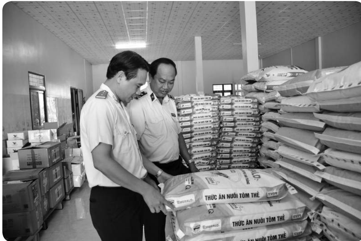
Đoàn kiểm tra liên ngành tỉnh kiểm tra thức ăn thủy sản tại một đại lý kinh doanh trên địa bàn tỉnh Sóc Trăng.