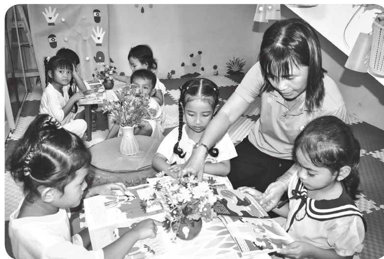
Giờ học của cô và trò Trường Mẫu giáo Long Phú, xã Long Phú, huyện Long Phú (Sóc Trăng).