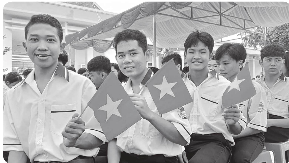
Các em học sinh là người dân tộc Khmer ở huyện Trần Đề (Sóc Trăng) trong ngày khai giảng năm học mới.