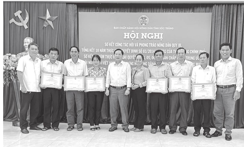
Ban Thường vụ Hội Nông dân tỉnh Sóc Trăng tặng bằng khen cho các tập thể có thành tích xuất sắc.

Chiều ngày 26/9, tại Hội Nông dân tỉnh, Ban Thường vụ Hội Nông dân tỉnh Sóc Trăng tổ chức Hội nghị sơ kết công tác Hội và phong trào nông dân quý III; tổng kết 10 năm thực hiện Quyết định số 81/2014/QĐ-TTg của Thủ tướng Chính phủ; sơ kết 5 năm thực hiện Nghị quyết số 04, 05, 06 của Ban Chấp hành Trung ương Hội Nông dân Việt Nam về xây dựng Hội Nông dân Việt Nam trong sạch, vững mạnh và phát động ủng hộ các tỉnh bị ảnh hưởng bão số 3. Tham dự hội nghị có đồng chí Trương Vũ Phương - Tỉnh ủy viên, Chủ tịch Hội Nông dân tỉnh Sóc Trăng; lãnh đạo các đơn vị, các cấp hội huyện, thị xã và thành phố.