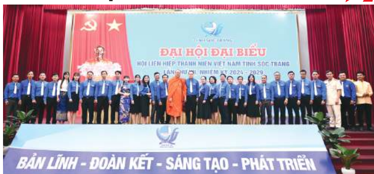
Ủy ban Hội Liên hiệp Thanh niên Việt Nam tỉnh Sóc Trăng, nhiệm kỳ 2024 - 2029 ra mắt đại hội.

Chủ tịch UBND tỉnh Sóc Trăng: Kiểm tra các công trình xây dựng trên địa bàn tỉnh