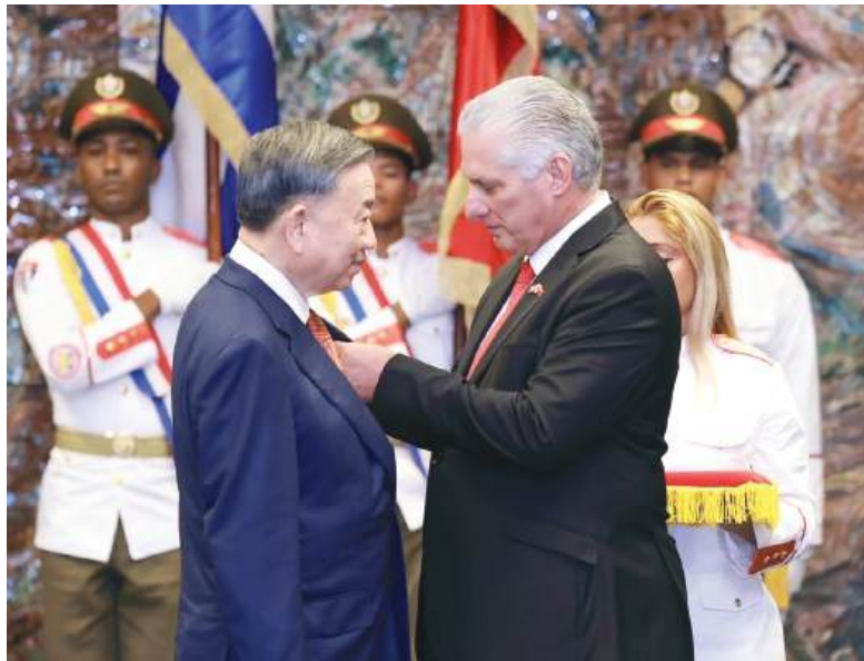
Bí thư thứ nhất Đảng Cộng sản Cuba, Chủ tịch Cuba Miguel Diaz Canel Bermudez trao tặng Huân chương Jose Marti cho Tổng Bí thư, Chủ tịch nước Tô Lâm.

đồng chí Bí thư thứ nhất, Chủ tịch nước Cuba, bà Lis Cuesta Peraza; các đồng chí Ủy viên Bộ Chính trị: Esteban Lazo Hernandez, Chủ tịch Quốc hội; Manuel Marrero Cruz, Thủ tướng Chính phủ; Roberto Morales Ojeda, Thường trực Ban Bí thư Trung ương Đảng Cộng sản Cuba; Alvaro Lopez Miera, Bộ trưởng Bộ các Lực lượng Vũ trang Cách mạng; Lazaro Alberto Alvarez Casas, Bộ trưởng Bộ Nội vụ; Emilio Lozada Garcia, Trưởng Ban Đối ngoại Trung ương Đảng Cộng sản Cuba cùng nhiều đồng chí lãnh đạo cấp cao khác.