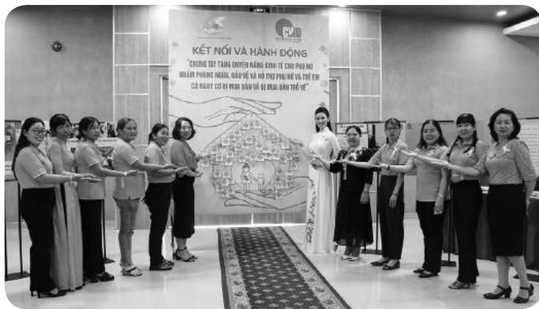
Hội Liên hiệp Phụ nữ tỉnh Sóc Trăng có nhiều hoạt động triển khai thực hiện Dự án 8.

lập mới 18 tổ truyền thông, nâng tổng số toàn tỉnh có 128 tổ truyền thông, vượt 8,47% chỉ tiêu giai đoạn I. Thành lập mới và củng cố 49 địa chỉ tin cậy, thực hiện công tác hỗ trợ theo quy định, nâng tổng số có 74 địa chỉ tin cậy, vượt 428% chỉ tiêu giai đoạn và các cấp hội còn tổ chức trên 600 cuộc tập huấn, tuyên truyền, vận động. Các cấp hội đã thực hiện bằng nhiều hình thức: truyền thông và lồng ghép hội thi; nói chuyện chuyên đề kết hợp hái hoa dân chủ; truyền thông thực hiện bình đẳng giới với chủ đề "Chuyện nhà tôi"; chiến dịch truyền thông lồng ghép "Hệ lụy của việc bỏ học, không có việc làm, tảo hôn, hôn nhân cận huyết thống"... Từ đó, đã tích cực thay đổi "nếp nghĩ, cách làm", hướng dẫn xây dựng mạng lưới truyền thông trên nền tảng số, truyền thông về xây