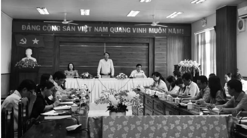
Lãnh đạo tỉnh Sóc Trăng quan tâm chỉ đạo, giám sát việc thực hiện chi trả ASXH trên địa bàn.