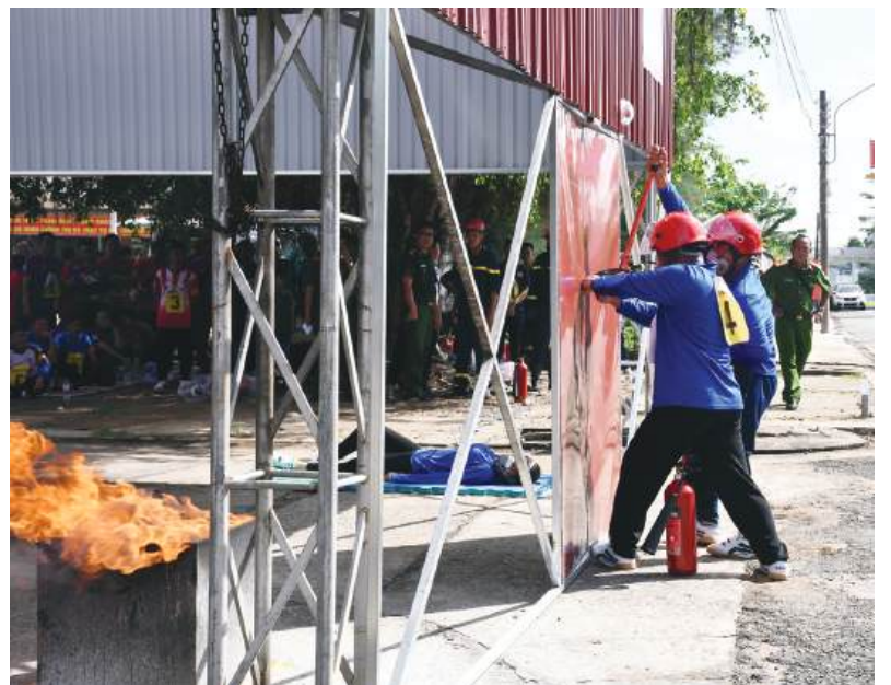
Tổ chức Hội thi nghiệp vụ chữa cháy và cứu nạn, cứu hộ “Tổ liên gia an toàn phòng cháy, chữa cháy” để nâng cao kỹ năng phòng cháy, chữa cháy.

• TỔNG BIÊN TẬP: NGUYỄN VĂN TRIỀU • GIẤY PHÉP XUẤT BẢN SỐ 833/GP-BTTTT DO BỘ TTTT CẤP NGÀY 30-12-2021 • BÁO SÓC TRĂNG RA MỖI TUẦN 3 KỶ: THỨ HAI, THỨ TƯ VÀ THỨ SÁU • SẮP CHỮ TẠI TÒA SOẠN BÁO SÓC TRĂNG • IN TẠI CÔNG TY CỔ PHẦN IN SÓC TRĂNG • GIÁ 3.500Đ