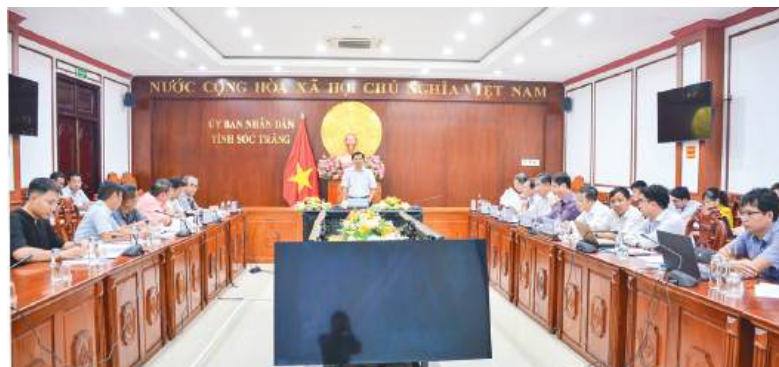
Quang cảnh buổi làm việc.

Chiều ngày 1/10, tại UBND tỉnh Sóc Trăng đã diễn ra buổi làm việc giữa đồng chí Trần Văn Lâu - Phó Bí thư Tỉnh ủy, Chủ tịch UBND tỉnh với Công ty Trách nhiệm hữu hạn DinTsun Việt Nam (Công ty thuộc Công ty Trách nhiệm hữu hạn DinTsun Holding) về những khó khăn, vướng mắc tại dự án Cụm công nghiệp Xây Đá B, huyện Châu Thành (Sóc Trăng). Cùng dự buổi làm việc có lãnh đạo các sở, ngành tỉnh và UBND huyện Châu Thành.