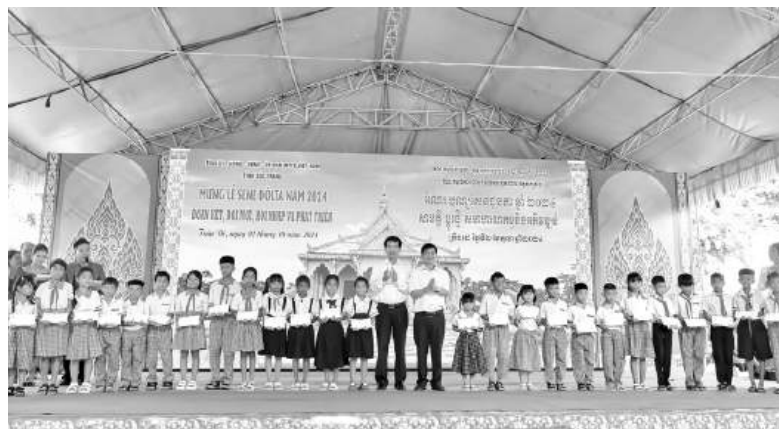
Lãnh đạo tỉnh Sóc Trăng trao những suất học bổng cho các em học sinh vượt khó học tốt.

hỗ trợ hộ nghèo, khó khăn trong vùng đồng bào dân tộc thiểu số. Toàn tỉnh đã có 70/80 xã được công nhận đạt chuẩn nông thôn mới (trong đó, có 34 xã vùng dân tộc thiểu số, chiếm gần 50%) và có 4 huyện, thị xã đạt chuẩn nông thôn mới. Các chính sách an sinh xã hội được triển khai đầy đủ, kịp thời. Trong giai đoạn 2021 - 2024, toàn tỉnh đã vận động hỗ trợ xây dựng 5.248 căn nhà ở cho hộ nghèo, với tổng kinh phí khoảng 280 tỷ đồng (trong đó có 1.876 hộ nghèo Khmer được hỗ trợ), qua đó, giúp cho hộ nghèo có nơi sinh sống ổn định, yên tâm lao động, sản xuất, phát triển kinh tế, thoát nghèo bền vững.