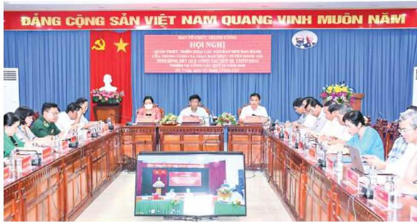
Lãnh đạo tỉnh Sóc Trăng và đại biểu dự hội nghị trực tuyến tại điểm cầu tỉnh Sóc Trăng.

Chuẩn bị nhân sự và bầu cử phải được thực hiện nghiêm, đúng nguyên tắc, quy định