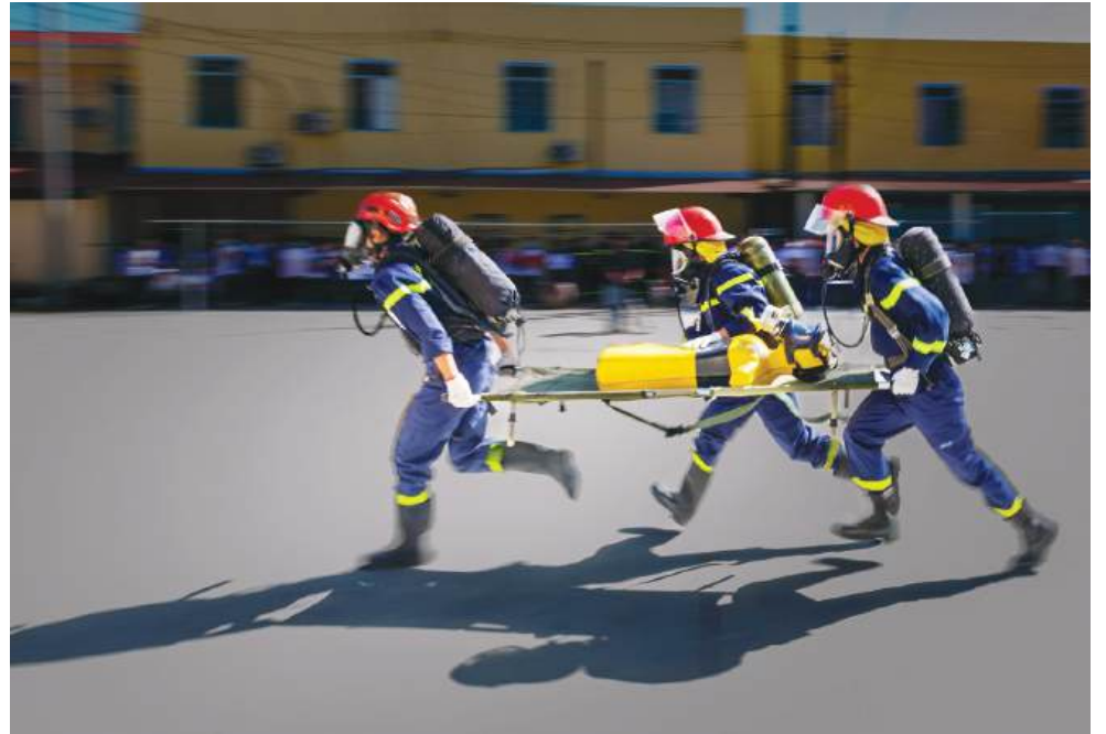
Giả định tình huống cứu hộ nạn nhân bị ngạt khói.