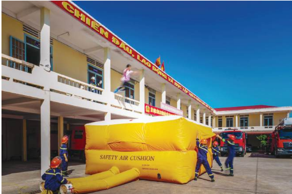
Diễn tập giả định tình huống, do tác động của đám cháy, khu vực hành lang nhiễm khói đậm đặc nên không thể sử dụng cầu thang bộ để đưa người bị nạn thoát ra an toàn. Các chiến sĩ cứu nạn, cứu hộ quyết định triển khai đội hình “đệm hơi cứu hộ nhà cao tầng” để giải cứu nạn nhân ra ngoài.