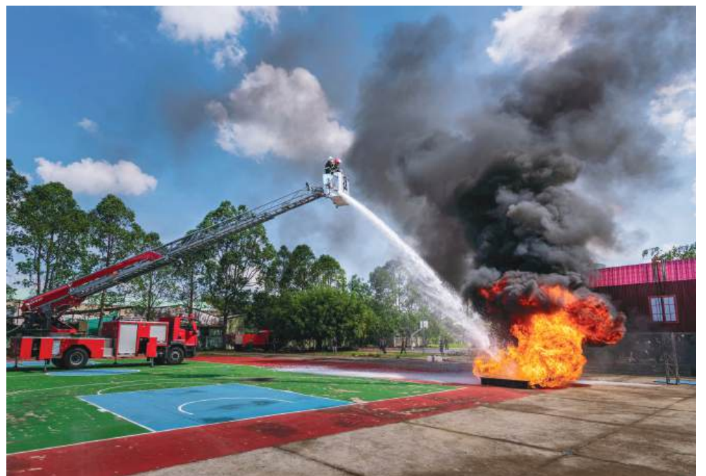
Dùng xe nâng chuyên dụng chữa cháy trên cao.