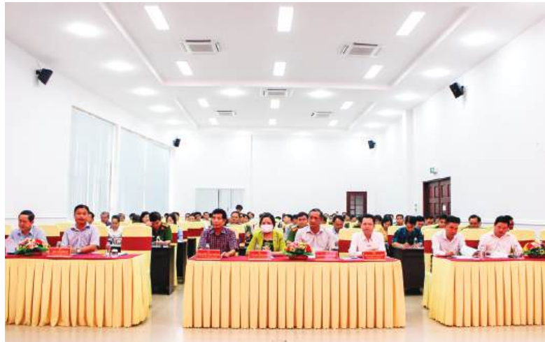
Quang cảnh Hội nghị bồi dưỡng, cập nhật kiến thức về công tác phòng, chống tham nhũng, tiêu cực năm 2024.

Sáng ngày 3/10, tại Trung tâm Văn hóa và Hội nghị tỉnh, Ban Thường vụ Tỉnh ủy Sóc Trăng tổ chức Hội nghị bồi dưỡng, cập nhật kiến thức về công tác phòng, chống tham nhũng, tiêu cực năm 2024.