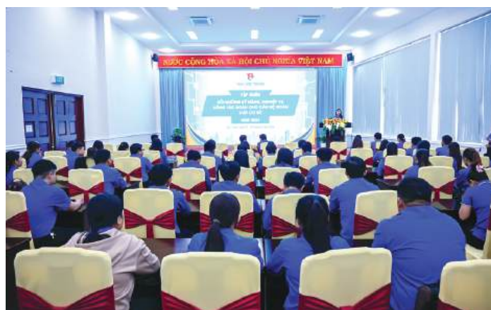
Quang cảnh hội nghị tập huấn.

Nội dung hội nghị tập huấn gắn với thực tiễn của công tác đoàn và phong trào thanh thiếu nhi của tỉnh và khung