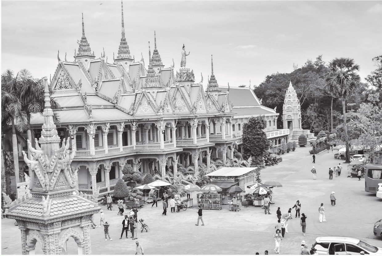
Chùa Bô Tum Vong Sa Som Rong, thành phố Sóc Trăng (Sóc Trăng) là một trong những điểm đến hấp dẫn của du khách trong và ngoài nước.

Sóc Trăng là vùng đất có nhiều tiềm năng phát triển du lịch, bởi nơi đây có nhiều lễ hội đặc sắc và là nơi giao thoa văn hóa của 3 dân tộc: Kinh - Khmer - Hoa, tạo nét văn hóa mang đậm màu sắc riêng, như: công trình kiến trúc, văn nghệ, thể thao, ẩm thực... Do đó, tỉnh đã khai thác du lịch đi đôi với bảo tồn, giữ gìn, bảo vệ các di tích lịch sử văn hóa một cách khoa học.