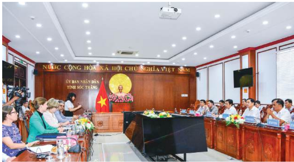
Các đại biểu dự buổi làm việc.

Chiều ngày 2/10, tại UBND tỉnh Sóc Trăng, đồng chí Lâm Hoàng Nghiệp - Ủy viên Ban Thường vụ Tỉnh ủy, Phó Chủ tịch Thường trực UBND tỉnh có buổi tiếp và làm việc với đoàn công tác của Tổ chức Hợp tác quốc tế Đức (GIZ) về tình hình hợp tác giữa GIZ và tỉnh Sóc Trăng trong triển khai các dự án.