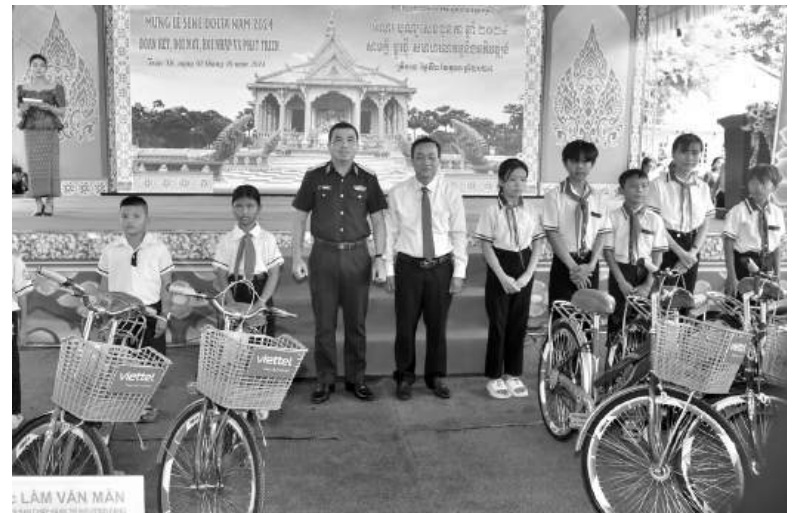
Lãnh đạo tỉnh Sóc Trăng và nhà tài trợ trao tặng xe đạp cho 20 học sinh nghèo vượt khó học tốt.

hội đại biểu các dân tộc thiểu số tỉnh Sóc Trăng lần thứ IV.