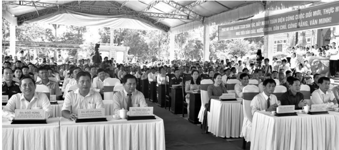
Đại biểu dự họp mặt mừng Lễ Sene Đôn Ta năm 2024.

Sáng ngày 2/10, tại chùa Pôthi Thum Phđau Pên (Lao Vên), xã Viên Bình, huyện Trần Đề (Sóc Trăng), Tỉnh ủy, HĐND, UBND, Ủy ban Mặt trận Tổ quốc Việt Nam tỉnh Sóc Trăng tổ chức buổi họp mặt mừng Lễ Sene Đôn Ta của đồng bào Khmer năm 2024, với chủ đề “Đoàn kết, đổi mới, hội nhập và phát triển”.