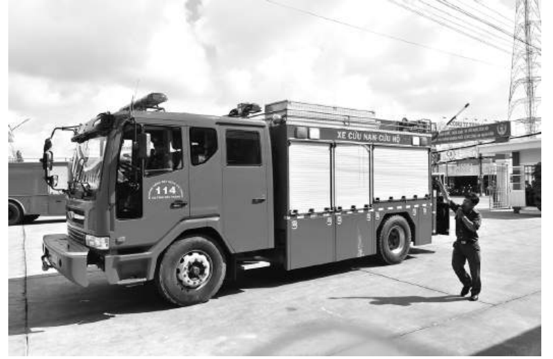
Đảm bảo phương tiện ứng phó với các tình huống cháy, nổ xảy ra.

Chế độ trực chỉ huy, trực ban, trực chiến luôn được đảm bảo, sẵn sàng ứng trực và có mặt kịp thời khi được sự điều động, phân công của lãnh đạo cấp trên. Trong 9 tháng năm 2024, đơn vị điều động 116 lượt xe chữa cháy cùng 786 lượt cán bộ, chiến sĩ tham gia các cuộc bảo