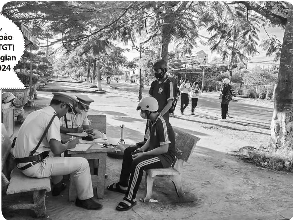
Kiểm tra, xử lý học sinh vi phạm về TTATGT, kết hợp với nhắc nhở, giáo dục để tránh tình trạng tái phạm.

Thông qua hoạt động nghiệp vụ để chủ động nắm chắc tình hình trên không gian mạng và qua các cơ quan thông tin đại chúng, hệ thống camera giám sát giao thông để xác định thời gian, phương thức, tuyến đường, địa điểm, nơi các đối