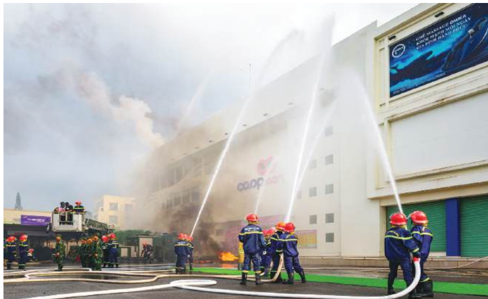
Huy động lực lượng khống chế đám cháy trong tình huống diễn tập.