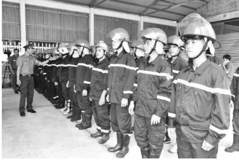
Lực lượng Cảnh sát PCCC và CNCH luôn sẵn sàng làm nhiệm vụ.

Thời gian qua, cùng với lực lượng Công an tỉnh Sóc Trăng nói chung, lực lượng Cảnh sát PCCC và CNCH đã bám sát yêu cầu, nhiệm vụ được phân công. Tham mưu lãnh đạo Công an tỉnh ban