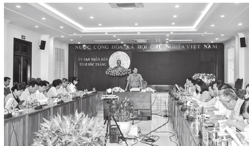
Quang cảnh cuộc họp.