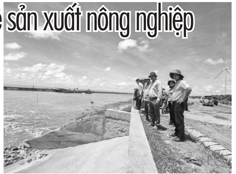
Lãnh đạo ngành Nông nghiệp tỉnh Sóc Trăng đến khảo sát tuyến đê biển trên địa bàn thị xã Vĩnh Châu.

Trước tình hình thiên tai diễn biến ngày càng phức tạp, để kịp thời ứng phó nhằm bảo vệ sản xuất của người dân, ngành Nông nghiệp tỉnh đã quan trắc độ mặn trên các sông, kênh,