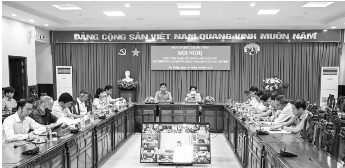
Các đại biểu dự hội nghị tại điểm cầu tỉnh Sóc Trăng.

Trong 5 năm qua (2019 - 2024), công tác phổ biến, quán triệt Quy định số 212-QĐ/TW của Ban Bí thư luôn được các cấp ủy, tổ chức đảng quan tâm, chú trọng. Các nội dung của Quy định số 212 cơ bản đồng