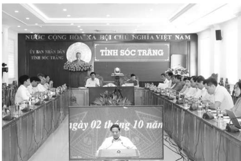
Các đại biểu tham dự tại điểm cầu Sóc Trăng.

Tính đến nay, Bộ Y tế đã tạo lập hơn 32 triệu dữ liệu sổ sức khỏe điện tử cho người dân, trong đó có hơn 14 triệu công dân đã tích hợp sổ sức khỏe điện tử trên VNelD với 12.518/12.693 cơ sở khám, chữa bệnh bảo hiểm y tế (đạt 98% số cơ sở khám, chữa bệnh trên cả nước) và đồng bộ liên