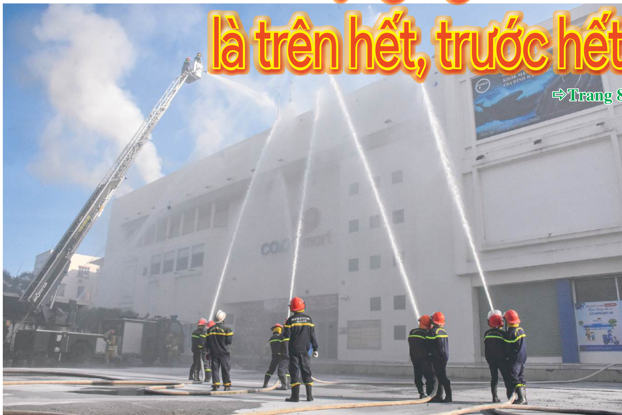
Cán bộ, chiến sĩ làm nhiệm vụ theo phương châm "Đảm bảo tính mạng của người dân là trên hết, trước hết".