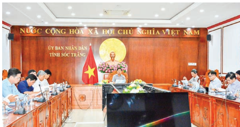
Các đại biểu tham dự cuộc họp.

Chiều ngày 25/11, tại UBND tỉnh Sóc Trăng, đồng chí Lâm Hoàng Nghiệp - Ủy viên Ban Thường vụ Tỉnh ủy, Phó Chủ tịch Thường trực UBND tỉnh có buổi làm việc với các cấp, ngành liên quan để nghe báo cáo đề xuất công trình chào mừng đại hội đảng bộ các cấp nhiệm kỳ 2025 - 2030.