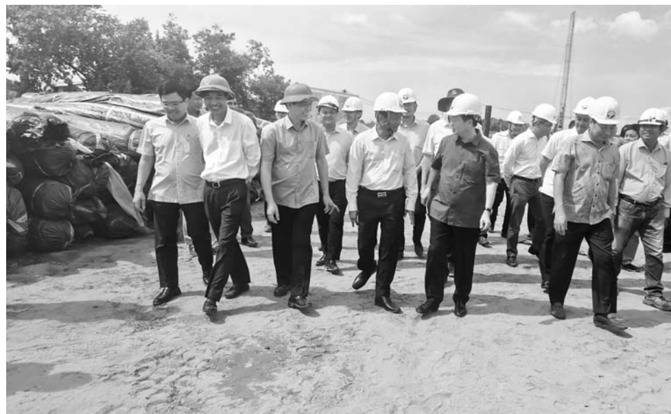
Phó Thủ tướng Chính phủ Trần Hồng Hà kiểm tra thực tế dự án cao tốc ở Sóc Trăng.