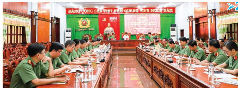
Quang cảnh đại biểu tham dự hội nghị.

Cụm thi đua số 11 Bộ Công an tổng kết phong trào thi đua “Vì an ninh Tổ quốc” năm 2024