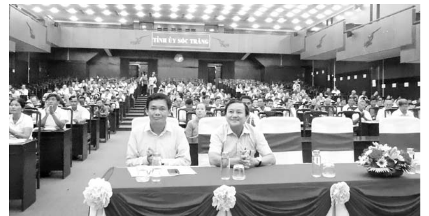
Các đại biểu tham dự Hội nghị tập huấn.

Tại hội nghị, các đại biểu được xem báo cáo về kết quả thực hiện Chương trình mục tiêu quốc gia phát triển kinh tế - xã hội vùng đồng bào dân tộc thiểu số trên địa bàn tỉnh Sóc Trăng năm 2024. Đồng thời, được nghe báo cáo viên triển khai về nội dung số 2 của Tiểu dự án 2, Dự án 5: đào tạo dự bị đại học, đại học và sau đại học đáp ứng nhu cầu cho vùng đồng bào dân tộc thiểu số thuộc Chương trình mục tiêu quốc gia phát triển kinh tế - xã hội vùng đồng bào dân tộc thiểu số giai đoạn 2021 - 2030, giai đoạn I (2021 - 2025) trên địa bàn tỉnh Sóc Trăng.