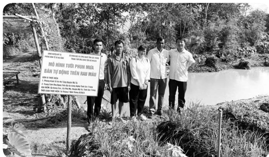
Mô hình tưới phun mưa bán tự động trên rau màu được áp dụng vào sản xuất nông nghiệp giúp nâng cao năng suất cây trồng.