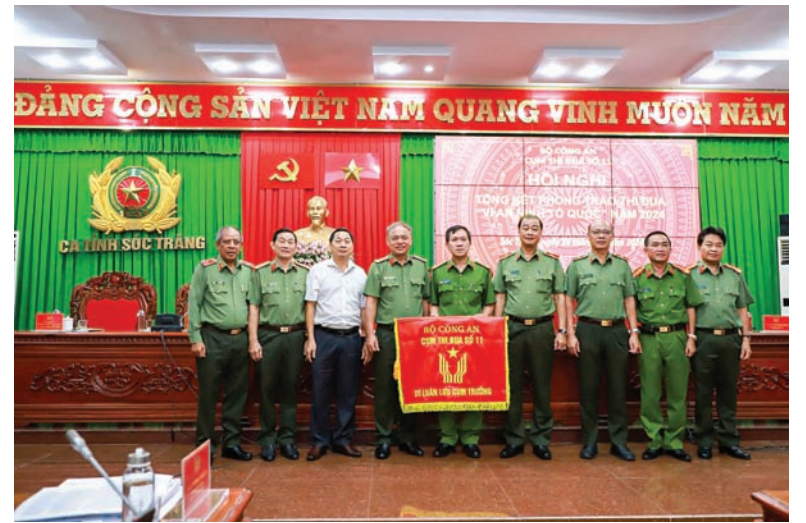
Công an tỉnh Tiền Giang nhận bàn giao đơn vị Cụm trưởng Cụm thi đua số 11.