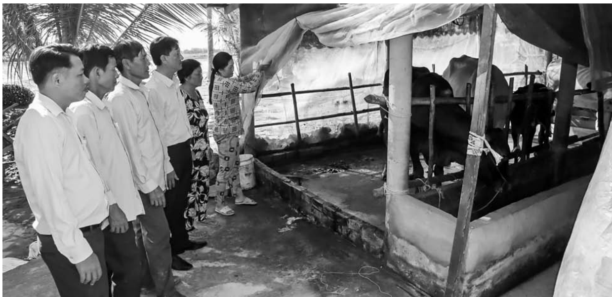
Nhờ sự đồng hành về vốn từ NHCSXH mà nhiều hộ gia đình đã thực hiện thành công các mô hình chăn nuôi.

Việc triển khai chính sách tín dụng ưu đãi thực hiện Chương trình mục tiêu quốc gia phát triển kinh tế - xã hội vùng dân tộc thiểu số và miền núi đã giải quyết những vấn đề căn bản, thiết yếu của cuộc sống người dân vùng dân tộc thiểu số và miền núi, giúp đồng bào dân tộc thiểu số có vốn làm ăn tại chỗ, tạo thêm việc làm tại địa phương, giảm thất nghiệp, ổn định đời sống, góp phần vươn lên thoát nghèo, làm giàu trên chính quê hương mình, thu hẹp dần khoảng cách về mức sống, thu nhập của đồng bào dân tộc thiểu số so với bình quân chung của cả nước.