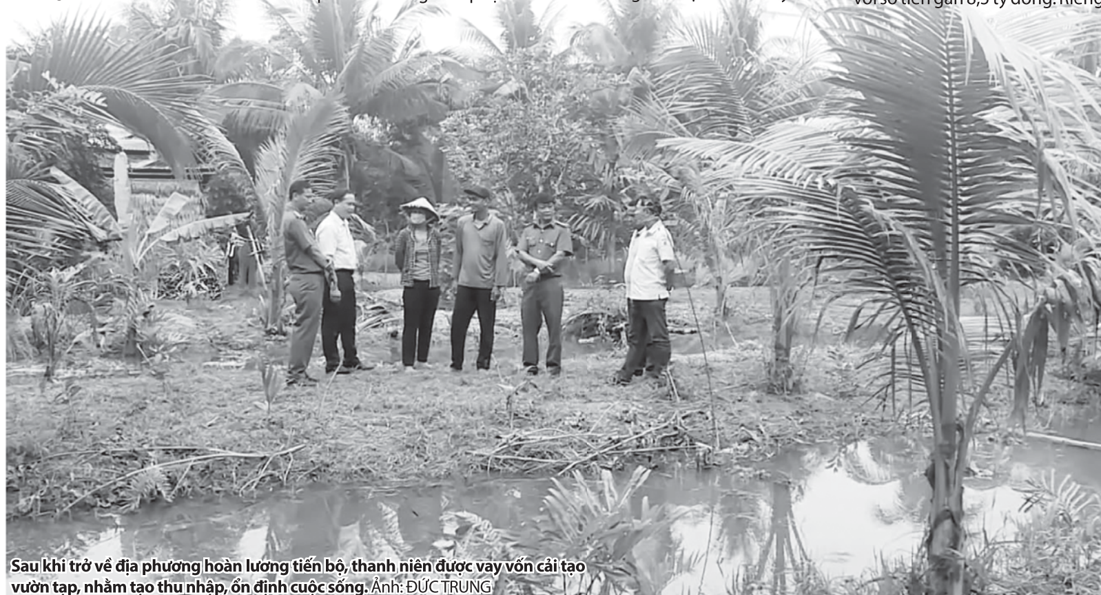
Sau khi trở về địa phương hoàn lương tiến bộ, thanh niên được vay vốn cải tạo vườn tạp, nhằm tạo thu nhập, ổn định cuộc sống.