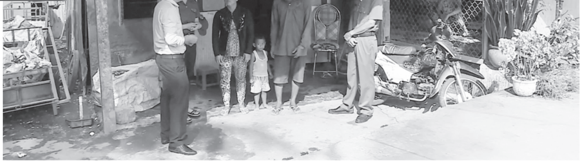
Chính quyền địa phương và cơ quan chức năng đến thăm hỏi, động viên người được vay vốn theo Quyết định số 22/2023/QĐ-TTg, ngày 17/8/2023 của Thủ tướng Chính phủ.