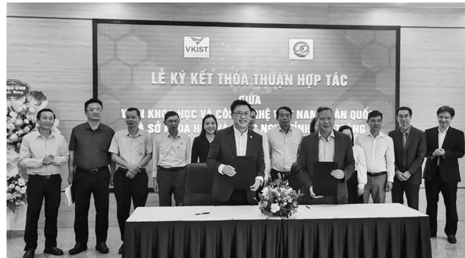
Sở KH&CN Sóc Trăng và Viện KH&CN Việt Nam - Hàn Quốc ký kết thỏa thuận hợp tác về KH&CN.

Vừa qua, Sở Khoa học và Công nghệ (KH&CN) Sóc Trăng và Viện KH&CN Việt Nam - Hàn Quốc (VKIST) ký kết thỏa thuận hợp tác về KH&CN. Sự kiện quan trọng này mở ra nhiều cơ hội mới, góp phần thúc đẩy, phát triển việc nghiên cứu KH&CN của tỉnh.