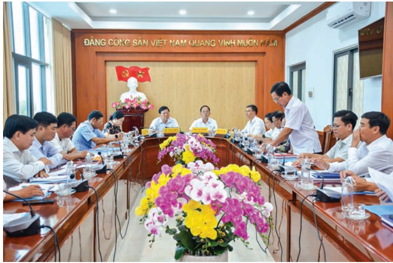
Quang cảnh cuộc họp.