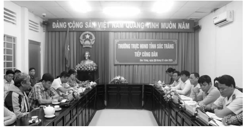
Quang cảnh buổi làm việc.

Thời gian qua, việc triển khai thi công, vận hành thử nghiệm, vận hành thương mại đối với các dự án điện gió trên đất liền có phản ánh, khiếu nại của một số hộ dân khu vực dự án. Cụ thể,