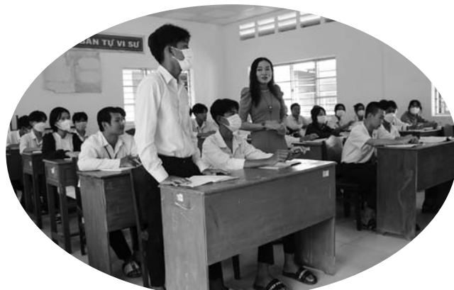
Trung tâm GDNN - GDTX thị xã Vĩnh Châu được đầu tư xây dựng thêm 4 phòng học mới vào năm học 2021 - 2022.

Về quản lý, tổ chức dạy học trung cấp nghề, hằng năm trung tâm thực hiện tốt công tác phối hợp, liên kết