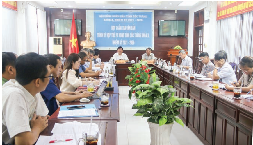
Các đại biểu tham gia đóng góp thẩm tra các báo cáo, tờ trình thuộc lĩnh vực pháp chế.