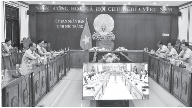
Các đại biểu tham dự hội nghị trực tuyến tại điểm cầu tỉnh Sóc Trăng.

Tại hội nghị, đại biểu đã nghe các bộ, ngành và các địa phương báo cáo về tình hình giải ngân vốn ODA, vốn vay ưu đãi 11 tháng năm 2024. Riêng đối với tỉnh Sóc Trăng, theo báo cáo của Sở Kế hoạch và Đầu tư, tình hình giải ngân đầu tư công vốn nước ngoài tính đến ngày 31/11, tổng kế hoạch vốn nước ngoài năm 2024 là 207.765 triệu đồng, trong đó, kế hoạch vốn ODA, vay ưu đãi cấp phát từ ngân sách Trung ương năm 2024 được phân khai là 124.833 triệu đồng (đạt 100% kế hoạch được Thủ tướng Chính phủ giao); kế hoạch vốn ODA, vay ưu