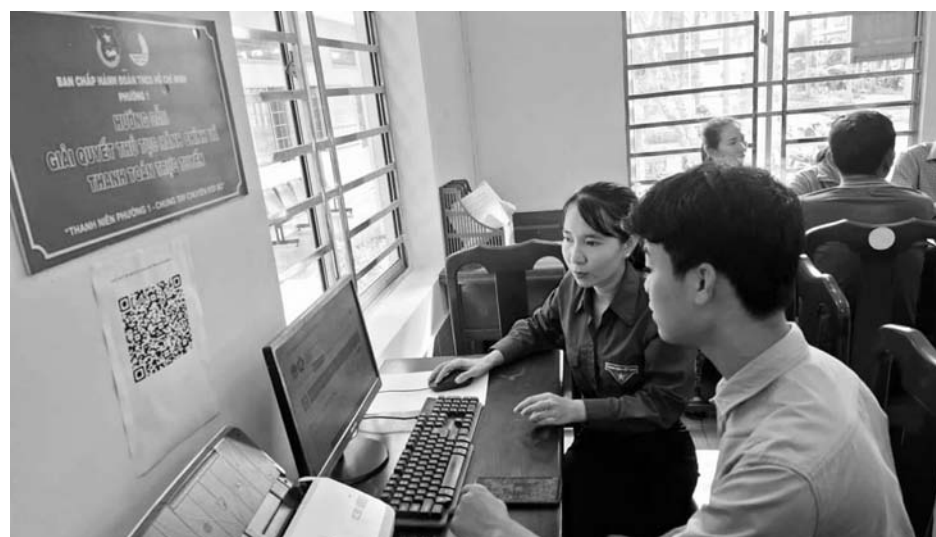
Đẩy mạnh tuyên truyền, hướng dẫn người dân việc thực hiện các dịch vụ công trực tuyến.

Để tiến tới xây dựng chính quyền điện tử, tiến tới nền hành chính hiện đại thì việc thanh toán trực tuyến trong giải quyết thủ tục hành chính là một trong nhiều giải pháp hiệu quả. Thanh toán trực tuyến mang lại nhiều tiện ích, giúp tiết kiệm thời gian, công sức, minh bạch trong thu ngân sách nhà nước và là tiến trình trong công cuộc chuyển đổi số. Phường 1, thị xã Ngã Năm (Sóc Trăng) là một trong những đơn vị thực hiện rất tốt vấn đề này và được Chủ tịch UBND thị xã Ngã Năm tặng giấy khen.