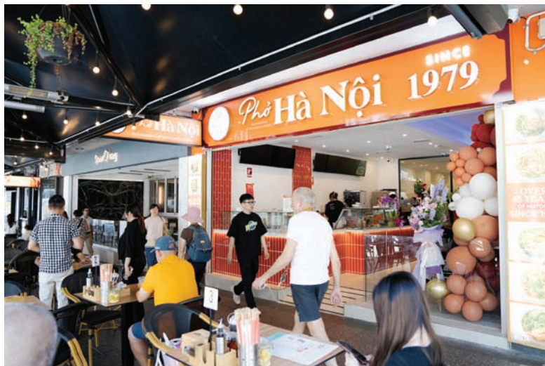
Nhà hàng "Phở Hà Nội 1979" thu hút nhiều thực khách đến thưởng thức.