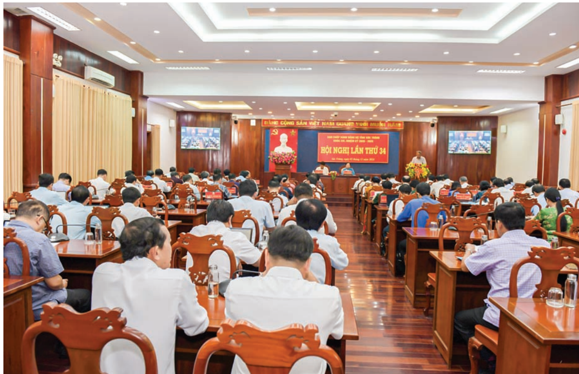
Quang cảnh Hội nghị Ban Chấp hành Đảng bộ tỉnh Sóc Trăng lần thứ 34.